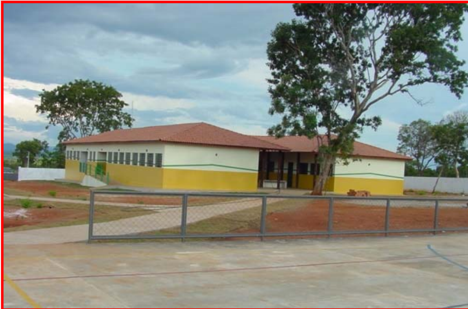
Escola Piabanha I