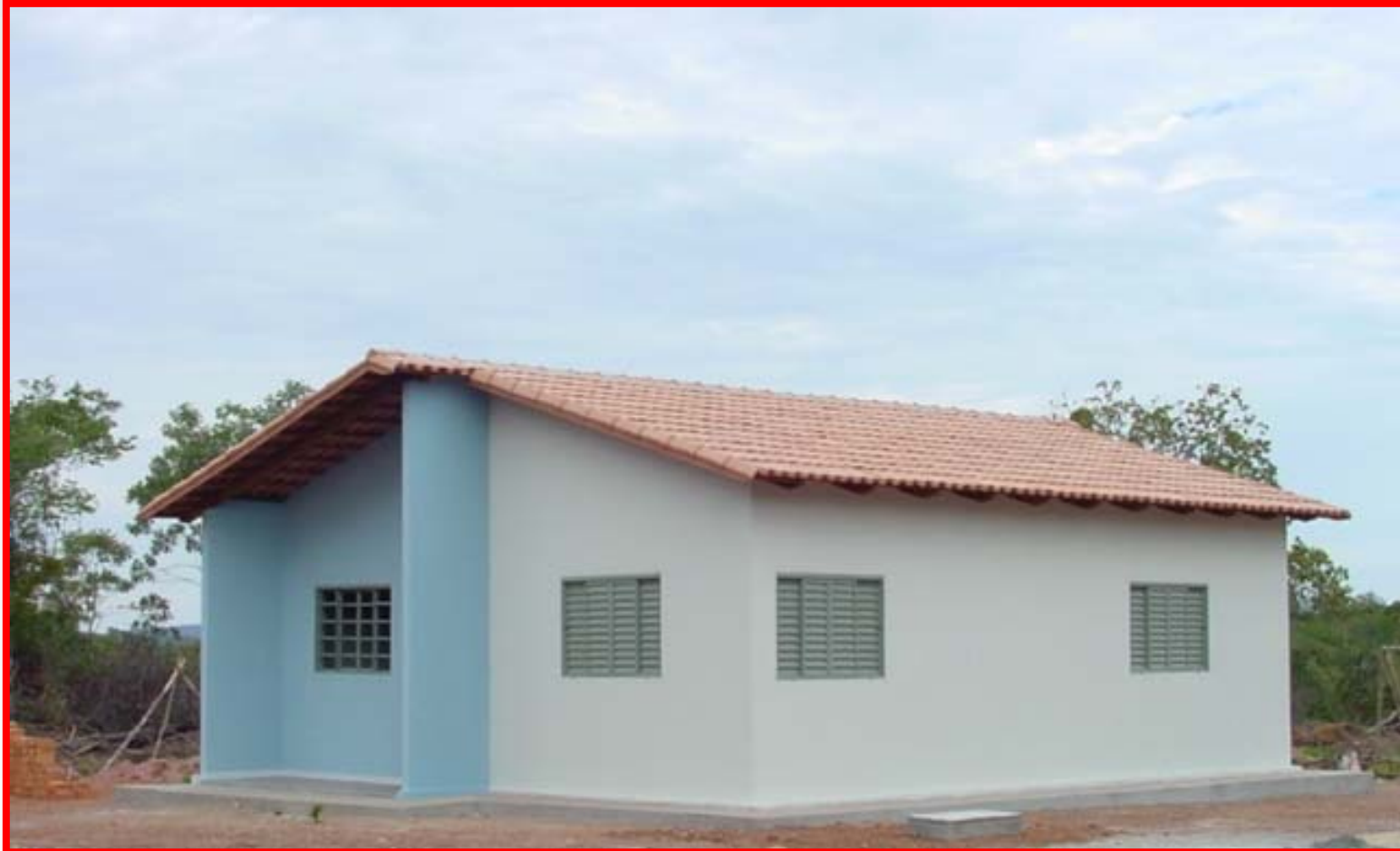
Casa dos Reassentamentos